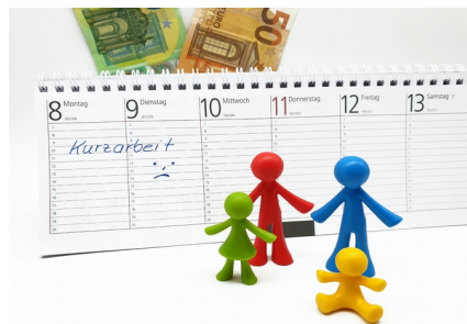
(Raiffeisenbank, redakčně kráceno)

V EU činil celkový mezičtvrtletní pokles zaměstnanosti 2,7 %, v meziročním srovnání 2,9 %. Jedná se o největší pokles od vzniku časové řady v roce 1995. Během druhého čtvrtletí byly přítomny ve většině zemí Evropské unie aktivní podpůrné programy, bez kterých by byla situace na pracovním trhu ještě složitější. Nezkreslený efekt pandemie je lépe vidět na počtu odpracovaných hodin, které mezičtvrtletně poklesly v EU o 10,7 %. V meziročním srovnání se jedná o pokles o 13,8 % v EU. Z geografického pohledu byl pokles počtu zaměstnaných nejsilnější ve Španělsku (-7,5 %), Irsku (-6,1 %), Maďarsku (-5,3 %) a Estonsku (-5,1 %).